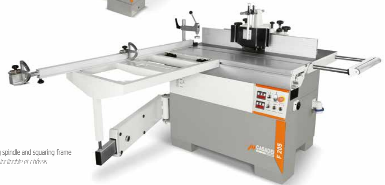
F 205 with tilting spindle and squaring frame avec arbre inclinable et châssis