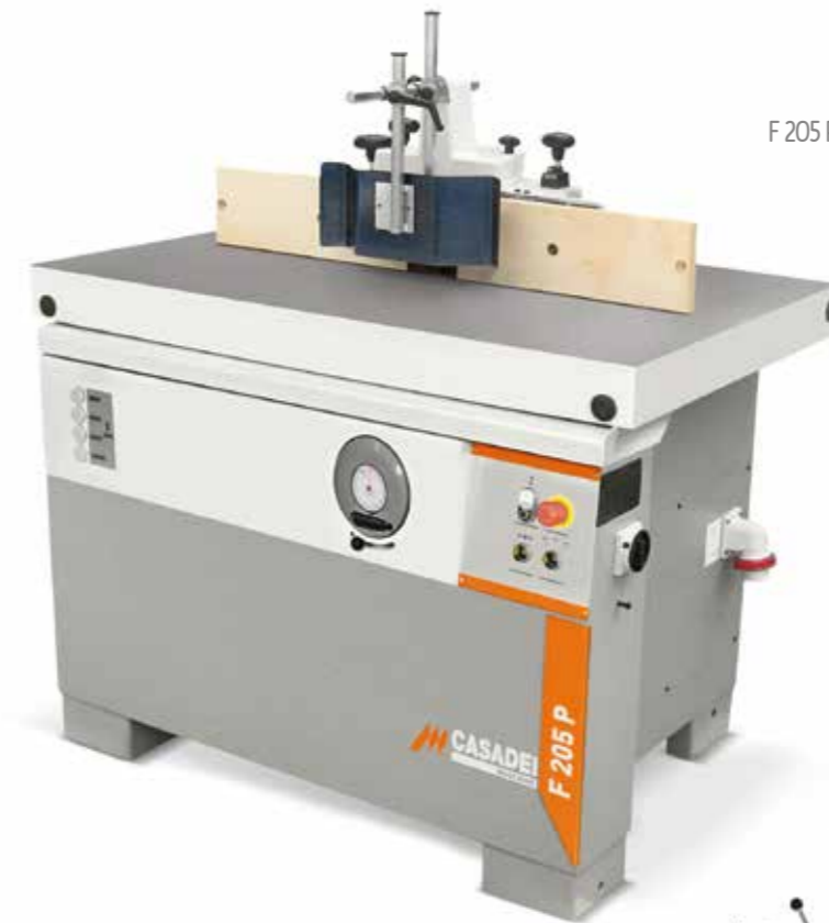
F 205 P